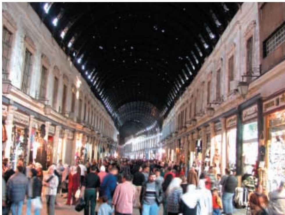
ساحتها استراحة لزوار العالم القديمة والأسواق القريبة