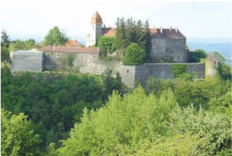
قلعة برنشتاين في بورغلاند، النمسا، حيث ولد الماشي، وفي اليوم فتدق.

تقنية لا تزال مستعملة إلى اليوم، إذ يجري تقليل الضغط لتجنب انغراز عجلات السيارة في الرمل. كانت رحلته إلى الصحراء الليبية في ١٩٣٣ من أهم جولاته الاستكشافية، وقد مسح هضبة الجلف الكبير، واستكشف مغارات جبال العوينات حيث عثر على رسوم كهوف حضارات عصور ما قبل التاريخ. وتعاون مع العالم الألماني ليغو فويينوس الذي نقب عن آثار الحضارات الأفريقية القديمة. وتعد اكتشافاته في العوينات وزرزورة من أهم أعماله. وأطلق اسمه على جبل في الجلف الكبير، جبل الماشي، تقديراً لمساهماته المهمة في استكشاف الصحراء، وبمناسبة الذكرى الستين لبعث مدير المتحف الجغرافي كوياسك مدير المتحف الجغرافي في مدينة أرد رحلة إلى المنطقة نفسها في العام ١٩٩٣ زارت الجلف