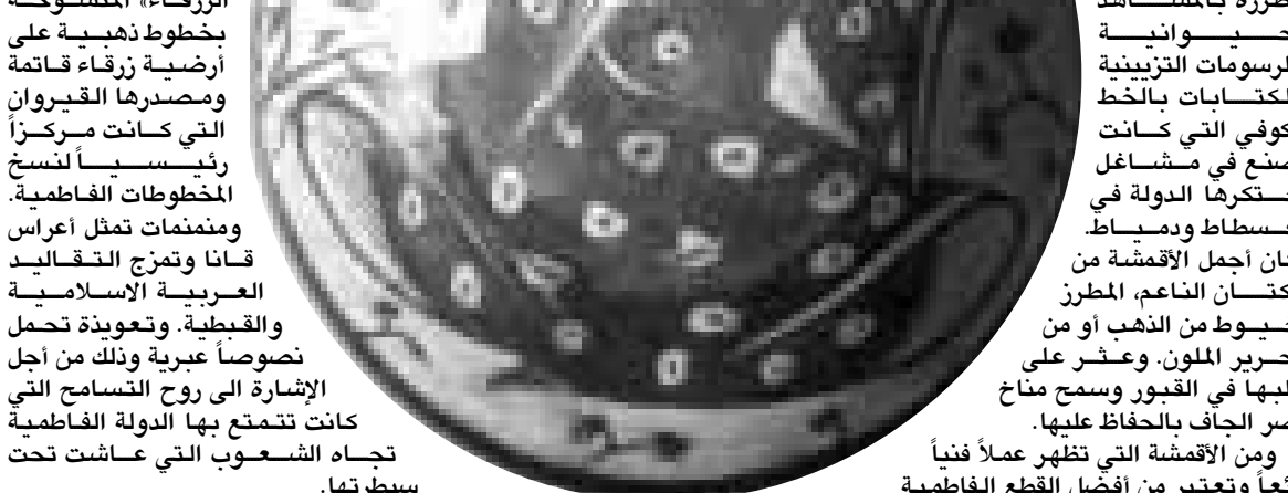
الكنوز الفاطمية في باريس

ومنمنمات تمثل أعراس قناتا وتمزج التقاليد العربية الإسلامية والقبليّة. وتعودية تحمل نصوصاً عبرية وذلك من أجل الإشارة إلى روح التسامح التي كانت تتسمع بها الدولة الفاطمية تجاه الشعوب التي عاشت تحت سيطرتها.