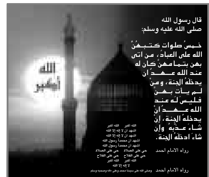
قال رسول الله صلى الله عليه وسلم: خمس صلوات كتبهن الله على الصباغ، من أتى بهن يتسارعن كان له عند الله عهدان يدخله الجنة، ومن لم يأت بهن فليس له عند الله عهدان يدخله الجنة، إن شاء الله.